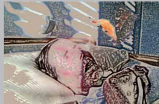
„Zwischen Himmel und Erde“, Leinwand auf Keilrahmen, 70 x 50 cm