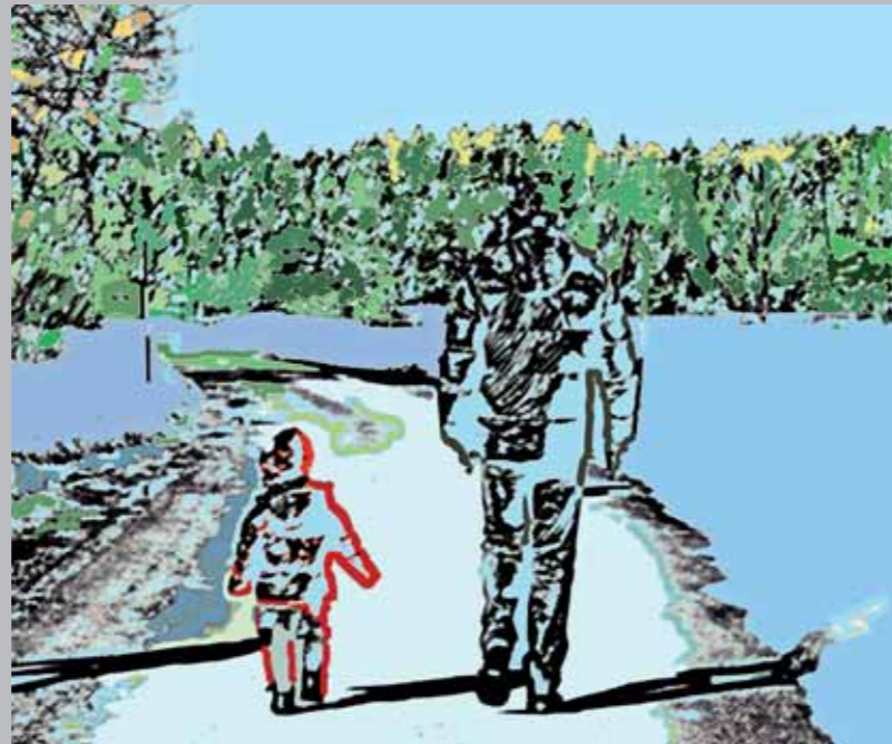
„Drei Schatten“, 60 x 50 cm, Leinwand auf Keilrahmen

2008 Ausstellung bei Thiersch I5 München