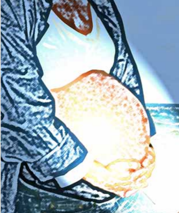
„HOPE“, 60 x 70 cm, Leinwand auf Keilrahmen